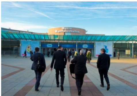
BU: Am 25.10.2016 beginnt die 20. DKM.

Kurzprofil bbg Betriebsberatungs GmbH: Die bbg Betriebsberatungs GmbH mit Sitz in Bayreuth ist als Kommunikations- und Informationsdienstleister Bindeglied zwischen Unternehmen und unabhängigen Vermittlern aus der Finanz- und Versicherungsbranche. Als Herausgeber des Fachmagazins AssCompact und des Online-Magazins ImmoCompact, Veranstalter der DKM sowie von Fachforen und Events bietet die bbg verschiedene Plattformen für Wissen, Information, Kommunikation und Kontakte.